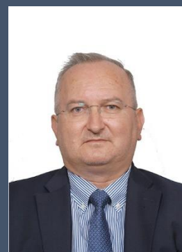
Βασίλειος Κατέρης Πρόεδρος Πρωτοδικών