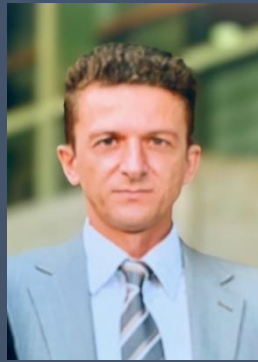
Χρήστος Τριανταφυλλίδης Πρόεδρος Πρωτοδικών

Σας υπενθυμίζουμε ότι σύμφωνα με το καταστατικό εκλέγεται υποχρεωτικά ένας τουλάχιστον Εισαγγελέας, ένας Πρωτοδίκης και ένας Ειρηνοδίκης