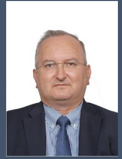
Βασίλειος Κατέρης Πρόεδρος Πρωτοδικών