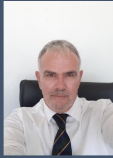
Γιώργος Σαπαντζής Εισαγγελέας Εφετών