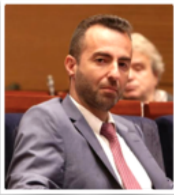
Χριστόφορου Σεβαστίδη, ΔΝ- Εφέτη Πρόεδρου της Ένωσης Δικαστών και Εισαγγελέων

Άρθρο του Προέδρου της Ε.Δ.Ε. κ. Χριστόφορου Σεβαστίδη