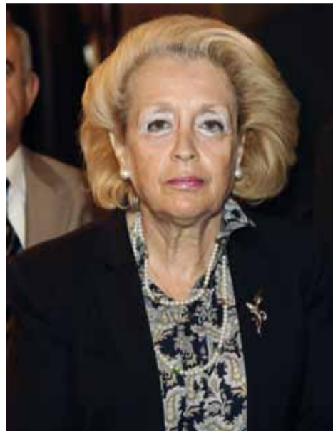
Η Πρόεδρος του Αρείου Πάγου κ. Βασιλική Θάνου - Χριστοφίλου προς τιμή της Ένωσής μας, παραμένει απλό μέλος του Διοικητικού Συμβουλίου

Η Εφέτης κ. Μαργαρίτα Στενιώτη, γνωρίζει την Αγγλική και τη Γαλλική γλώσσα, ενώ είναι έγγαμη και μητέρα ενός τέκνου.