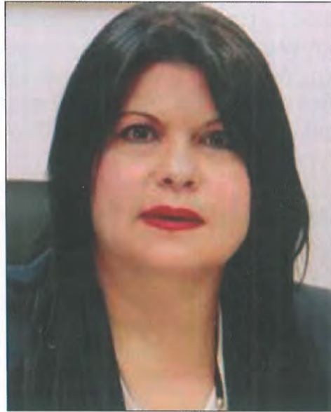
ΜΑΡΓΑΡΙΤΑ ΣΤΕΝΙΩΤΗ Εφέτης Αθηνών