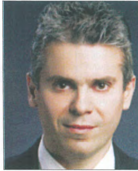
ΚΩΝΣΤΑΝΤΙΝΟΣ ΒΟΥΛΓΑΡΙΔΗΣ Πρόεδρος Πρωτοδικών Αθηνών