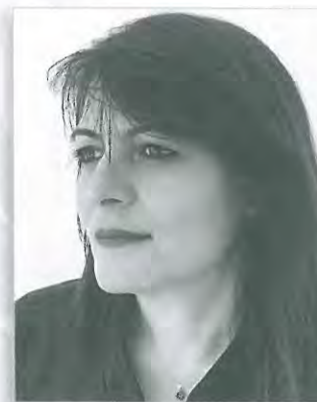
Κατερίνα Μπετσικώκου Πρ. Πρωτοδικών Αθηνών