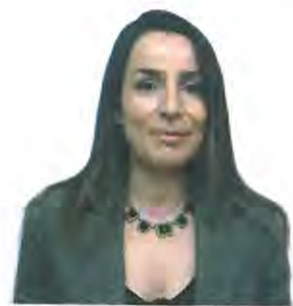
Ιδίως κατά τα τελευταία έτη, στα πλαίσια μίας οργανωμένης, αλλά μάταιης, προσπάθειας απαξίωσής της.

Κοινός στόχος μας και καίριο σημείο αναφοράς μας αποτελεί η ανάκτηση του ποικιλοτρόπως τρωθέντος κύρους και η διασφάλιση της αξιοπιστίας και ανεξαρτησίας της Δικαιοσύνης, η οποία, καίτοι αποτελεί, κατά τον Αριστοτέλη, τη μέγιστη αρετή, δοκιμάζεται και στοχοποιείται, ιδίως κατά τα τελευταία έτη, στα πλαίσια μίας οργανωμένης, αλλά μάταιης, προσπάθειας απαξίωσής της.