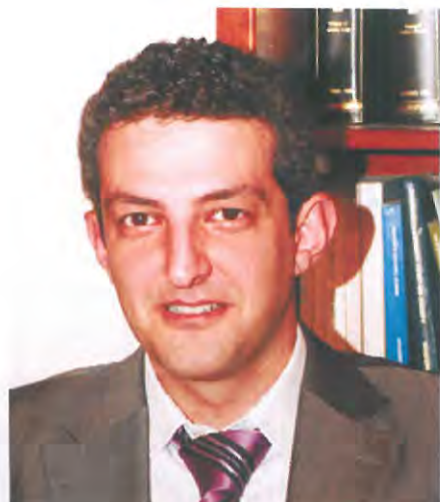
Χαράλαμπος Σεβαστίδης Πρόεδρος Πρωτοδικών