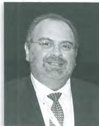
Τάκης Λυμπερόπουλος Εφέτης Αθηνών