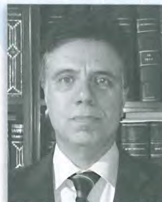
Γιώργος Σχοινοχωρίτης Εφέτης Αθηνών