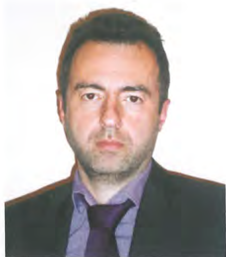
Χριστόφορος Σεβαστίδης Πρόεδρος Πρωτοδικών