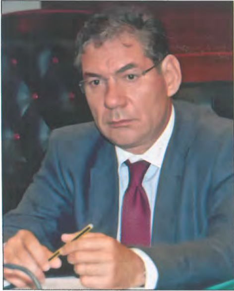
ΧΡΗΣΤΟΣ ΤΖΑΝΕΡΡΙΚΟΣ Πρόεδρος Εφετών Θράκης