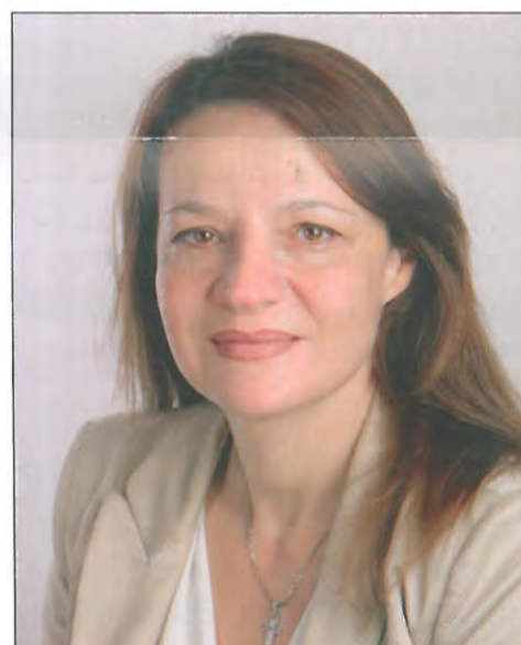
ΜΑΡΙΑ - ΦΑΝΗ ΠΑΛΑΜΙΔΗ Πρόεδρος Πρωτοδικών Χαλκίδας