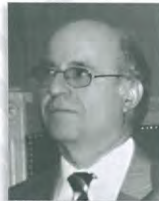
Παντελής Στραγάλης Εισαγγελέας Εφετών