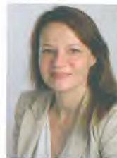
ΠΑΛΑΜΙΔΗ ΜΑΡΙΑ - ΦΑΝΗ Πρόεδρος Πρωτοδικών Χαλκίδας

ΑΠΟΔΕΙΞΑΜΕ ΟΤΙ ΘΕΛΟΥΜΕ ΚΑΙ ΜΠΟΡΟΥΜΕ ΝΑ ΕΠΙΤΥΓΧΑΝΟΥΜΕ ΤΟΥΣ ΣΤΟΧΟΥΣ ΜΑΣ