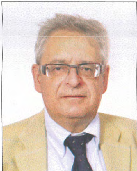
ΕΥΑΓΓΕΛΟΣ ΚΑΣΑΛΙΑΣ Αντεισαγγελέας Εφετών Πειραιά