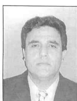
ΚΟΥΤΡΑΣ ΙΩΑΝΝΗΣ Εισαγγελέας Πρωτοδικών