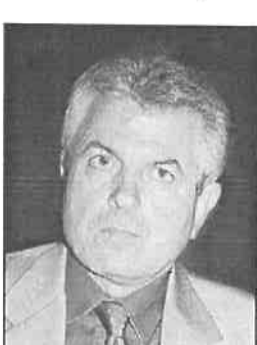
ΓΚΑΝΙΑΤΣΟΣ ΚΩΝ/ΝΟΣ Πρόεδρος Πρωτοδικών