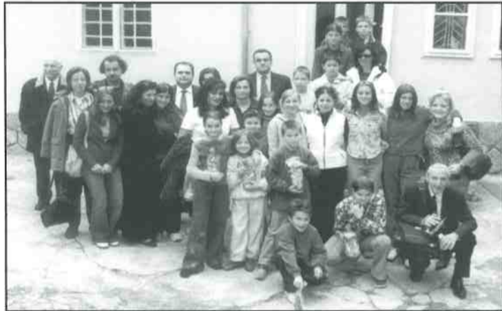
Με τα ορφανά Σερβόπουλα του Κόσσοβου.

Δεν θα μπορούσα ποτέ να φανταστώ, όταν συζητούσαμε την οργάνωση του ταξιδιού στη Σερβία, το πόσο μπορούσε ένας τόπος έξω από την Ελλάδα και οι άνθρωποι του, να επηρεάσει τη δική μου ζωή και μάλιστα καιρό μετά ακόμα και όταν οι εντυπώσεις στη μνήμη θα έπαισαν να έχουν τη σπιρτάδα της άμεσης αίσθησης. Ένα ταξίδι λοιπόν, στη Σερβία που οι συμμετέχοντες, ξεκινούσαμε από διαφορετικές αφετηρίες. Οι συνάδελφοι, που μετείχαν στην τότε αποστολή της Ένωσης για τη μεταφορά της βοήθειας στο σέρβικο λαό, κουβαλούσαν τις μνήμες του πολέμου, που σημάδεψε μία χώρα το 1999, το βίωμα της μουροδιάς του θανάτου, της σκόνης που καταλαγιάζει μετά την έκρηξη της βόμβας, του θάρρους των ανθρώπων που δεν ήθελαν να υποταγούν σε προδιανεγραμμέ-