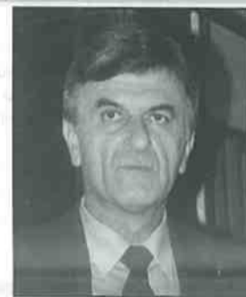
Ο Υπ. Δικαιοσύνης κ. Φ. Πετσάλνικος

μας του 1996. Οι συσχετισμοί άλλαξαν, οι βιωτικές ανάγκες πλήθυναν και τα