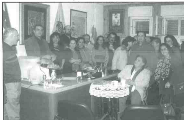
Στα γραφεία του Ελληνοσερβικού Συνδέσμου.

τον κατοικούν. Εκείνο το βράδυ πληροφορήθηκα το πόσο μόνους έχει αφήσει η σύγχρονη ελληνική πολιτεία αυτούς τους ανθρώπους να προσπαθούν να διαδώσουν τα ελληνικά γράμματα στη Βαλκανική χερσόνησο. Αιτήματα για την ίδρυση ελληνικού σχολείου στη Σερβία έχουν υποτίθεται ικανοποιηθεί αλλά δεν έχουν υλοποιηθεί, αιτήματα για οικονομική βοήθεια έχουν μείνει αναπάντητα, αιτήματα για παροχή βοήθειας σε υλικό επίπεδο (βιβλία, σημαίες, μουσική κλπ.) είναι σε μόνιμη εξέταση και μόνον η απλόχερη θυσία χρόνου, χρημάτων και πολύ κόπου από τα μέλη του σωματείου μπορεί να διατηρεί σήμερα αυτή τη φλόγα για τον ελληνισμό. Η υποδοχή μας από τους ανθρώπους αυτούς ήταν συγκινητική αλλά ταυτόχρονα και ένα μάθημα για το τι θα μπορούσαμε, ως χώρα, να χρησιμοποιήσουμε ως όπλα για να επιτύχουμε τους στόχους μας στην εξωτερική πολιτική στα Βαλκάνια και όχι μόνο. Είναι τραγικό να διαπιστώνεις πόσο γόνιμο είναι το έδαφος για να δεχθεί το ελληνικό πνεύμα, αν απλά και μόνο εδώ στην Ελλάδα, αποβάλαμε τα συμπλέγματα που μας αδραντοποιούν. Η συνάντηση με τα μέλη του Σωματείου