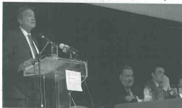
Ο κ. Σηφουνάκης χαιρετά το Συνέδριο.

Την πρώτη ημέρα (3 Ιουνίου) το Συνέδριο ξεκίνησε με την παρουσίαση του προγράμματος, των επισήμων προσκεκλημένων και των εισηγητών από τον Πρόεδρο της Ένωσης Δικαστών και Εισαγγελέων κ. Χαράλαμπο Αθανασίου, Αρσενόπατη, τον Πρόεδρο του Δικηγορικού Συλλόγου Μυτιλήνης κ. Δημήτρη Καλλιός, τον Αρχηγό της Αποστολής του Διεθνούς Οργανισμού Μετανάστευσης Ελλάδος κ. Δανιήλ Εσδρά. Ακολούθως, ο κ. Αθανασίου, άνοιξε τις εργασίες του Συνεδρίου με Γενική Εισήγηση επί του θέματος, ενώ χαιρετισμούς απηύθυναν, ο Μητροπολίτης Μηθύμνης κ.κ. Χρυσόστομος, ο Αναπληρωτής Υπουργός Περιβάλλοντος κ. Ν.Σηφουνάκης, ως εκπρόσωπος της Κυβέρνησης, ο εκπρόσωπος της Νέας Δημοκρατίας κ.Ν. Δένδιας, πρώην Υπ. Δικαιοσύνης, ο Πρόεδρος του Αρείου Πάγου κ. Γ.Καλαμίδας, ο Εισαγγελέας του Αρείου Πάγου κ. Ι.Τέντες, ο Πρόεδρος του Ν.Σ.Κ. κ. Φ.Γεωργακόπουλος, ο Πρόεδρος του Ταχυδρομικού Ταμιευτηρίου, κ. Κ.Παπαδόπουλος, οι Πρόεδροι των Δικηγορικών Συλλόγων Μυτιλήνης κ. Δ. Καλλιός, Αθηνών κ. Ι. Αδαμόπουλος, Θεσ/κής κ. Ν.Βαλεργάκης, Χίου κ. Ι. Τσούρος, ο Γενικός Γραμματέας του Δικηγορικού Συλλόγου Πειραιά κ.Γ.Σταματόγιαννης, ο Πρόεδρος των Ελλήνων Δικονομολόγων κ. Β. Ρήγας, ο εκπρόσωπος του Διεθνούς Οργανισμού Μετανάστευσης κ. Δ. Εσδράς, ο Περιφερειάρχης Β. Αιγαίου κ. Ν. Γιακαλής, ο Δήμαρχος Μυτιλήνης κ.Δ. Βουνάτσος, ο Πρόεδρος της ΟΛΣΑ κ. Χ.Τσακιρέλλης και ο Πρόεδρος της Ομοσπονδίας Δικαστικών Υπαλλήλων κ. Χ.Λυμπερόπουλος.