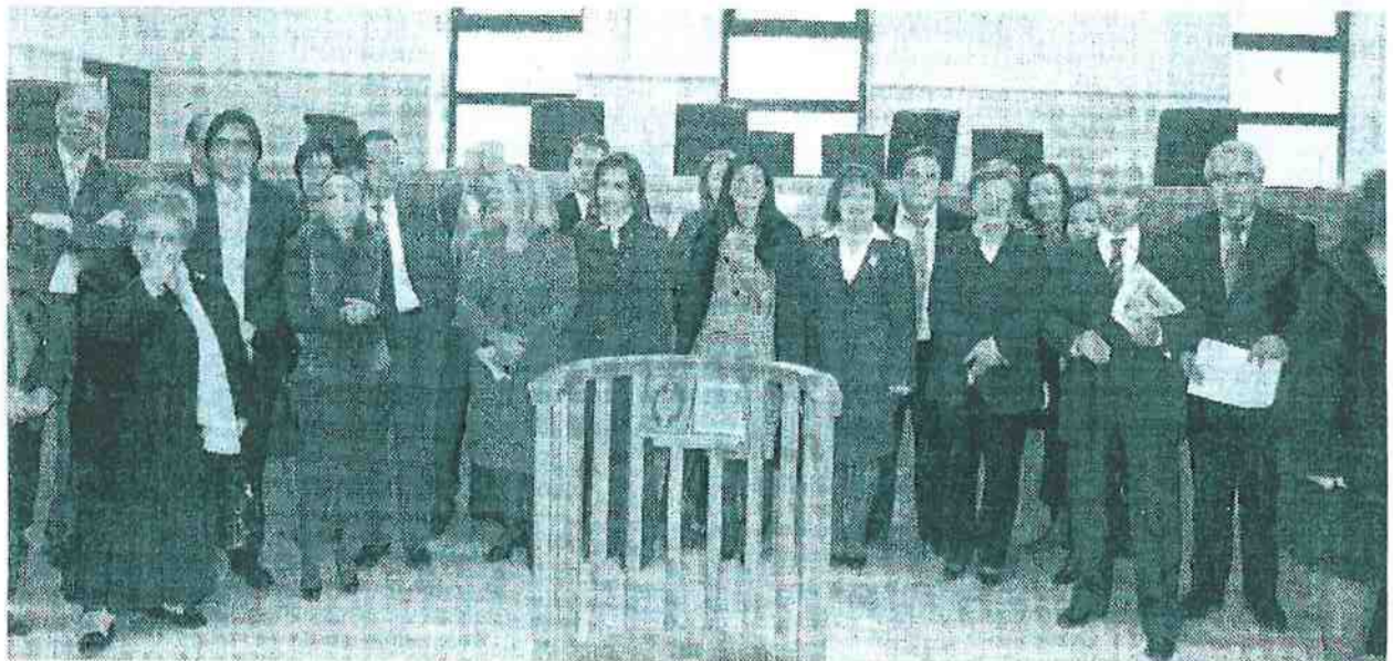
Από τη συγκέντρωση στο Δικαστικό Μέγαρο Κομοτηνής