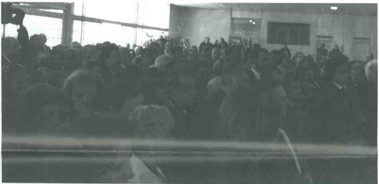
Από τη συγκέντρωση στον Άρειο Πάγο