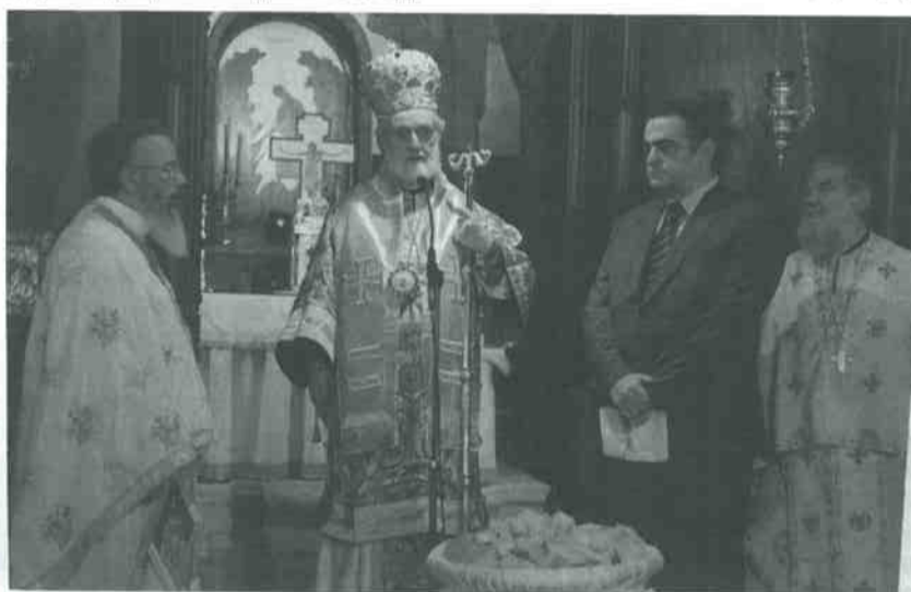
Ο Μητροπολίτης Περγάμου με τον Πρόεδρο της Ένωσης

Οι Διοικήσεις και τα μέλη όλων των Ενώσεων, που υπηρετούν στο χώρο απονομής της Δικαιοσύνης. Η Ένωση Δικαστικών Λειτουργιών του Συμβουλίου της Επικρατείας, η Ένωση Δικαστικών Λειτουργιών του Ελεγκτικού Συνεδρίου, η Ένωση Διοικητικών Δικαστών, η Ένωση Εισαγγελέων Ελλάδος, η Ένωση Δικαστικών Λειτουργιών της Στρατιωτικής Δικαιοσύνης, η Ένωση των μελών του Ν.Σ.Κ., η Ομοσπονδία Δικαστικών Υπαλλήλων Ελλάδος και η Ένωση Δικαστών και Εισαγγελέων που έχω την τιμή να εκπροσωπώ, σας υποδεχόμαστε, με ιδιαίτερη τιμή, σεβασμό και ευχαριστίες, στην σημερινή μας εκδήλωση, με την ευκαιρία της εικοστής τρίτης επετείου από την καθιέρωση του Αγ. Διονυσίου του Αρεοπαγίτη σε προστάτη των Δικαστικών Λειτουργιών της χώρας.