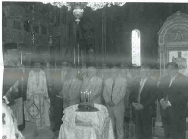
Ο Μακαριώτατος στην Ιερά Μονή Πεντέλης

Και αποκτά ιδιαίτερη βαρύτητα και λαμπρότητα η σημερινή ημέρα, Μακαριώτατε, με την παρουσία σας. Γιατί η παρουσία σας εδώ δείγμα της εφέσεως και διαθέσεως που έχετε να επικοινωνείτε με το ποιμνίο σας, διακονούντες αυτό και υπηρετούντες «λόγω και έργω» την ανθρωπινή αποστολή της Εκκλησίας, όπως αναφέρεται στην Αγία Γραφή, εκ της οποίας και συγκροτείται η Ορθοδοξία. Γιατί η παρουσία σας καταδεικνύει την αγάπη σας προς τους λειτουργούς της Δικαιοσύνης. Γι' αυτό και εκ μέρους όλων των Δικαστικών Ενώσεων, της Ενώσεως των μελών του ΝΣΚ και της Ομοσπονδίας των Δικαστικών Υπαλλήλων, σας ευχαριστούμε, διότι αποδεχθήκατε την πρόσκλησή μας να παρευρεθείτε την εύσημη τούτη μέρα ευχαριστιών προς τον Θεό, για τη λήξη του δικαστικού έτους και την έξοδο από την ενεργό υπηρεσία συναδέλφων Δικαστών και Εισαγγελέων, αλλά και για τους λόγους αγάπης που φιλόφρονα μας απευθύνετε.